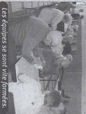
Les équipes se sont vite formées.

Saint-Souplet > Club des aînés Cartes et papotages