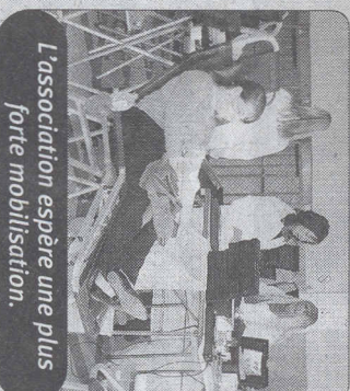
L'association espère une plus forte mobilisation.

■ Le nombre de donneurs n'a pas varié par rapport à la matinée du mois de mars. 72 donneurs ont été enregistrés dont deux nouvelles inscriptions. L'Association de donneurs de sang de Saint-Souplet lance un appel pour qu'un mois de mars 2010 une plus forte mobilisation permette de largement dépasser ces 72 donneurs.